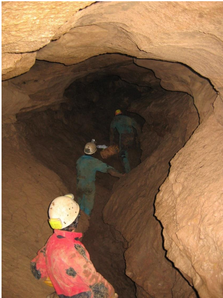
Grotte Mateu.