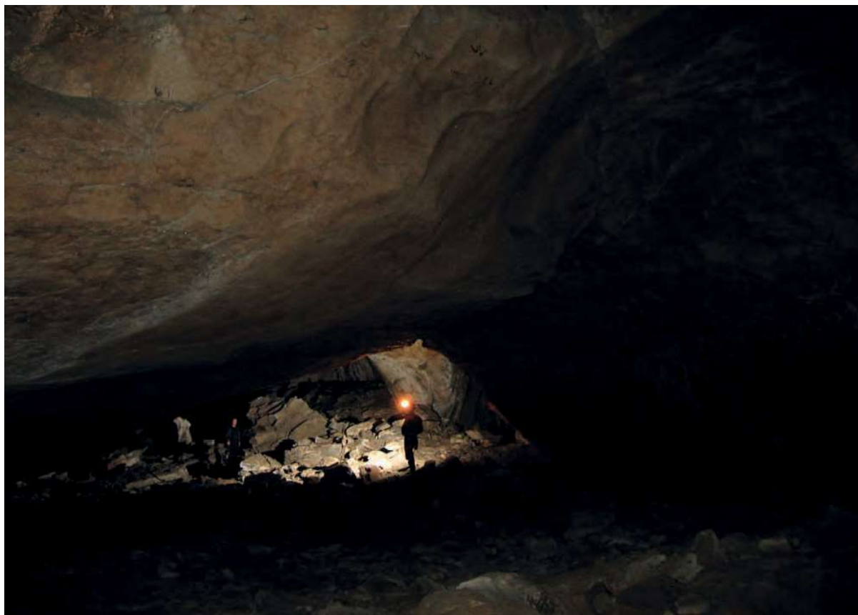
Cueva de Los Trillos.