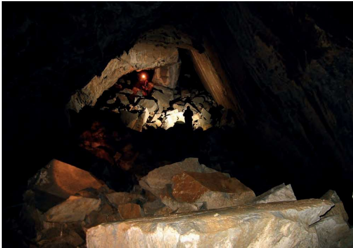
Cueva de Los Trillos.