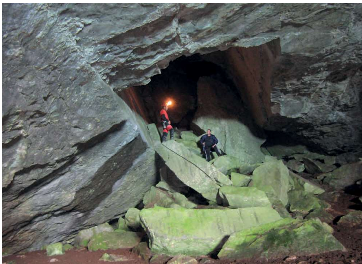
Cueva de Los Trillos.