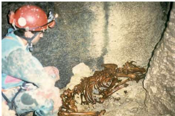
Cueva de Los Trillos. Restos de oso.