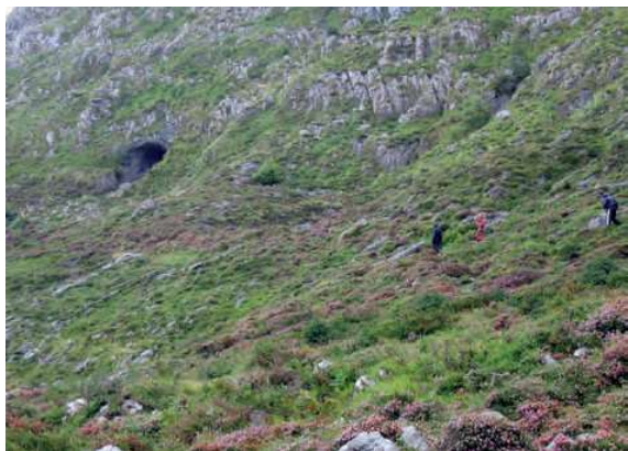
Cueva de Los Trillos.