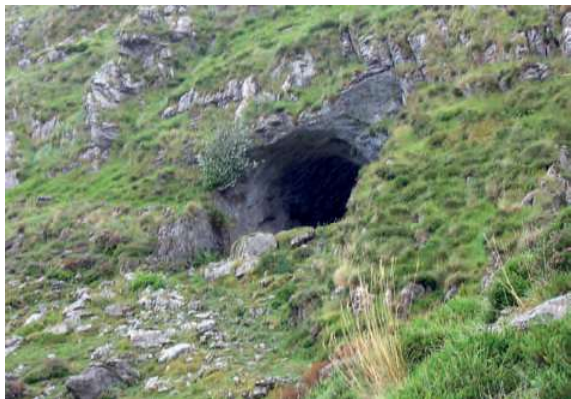
Cueva de Los Trillos.