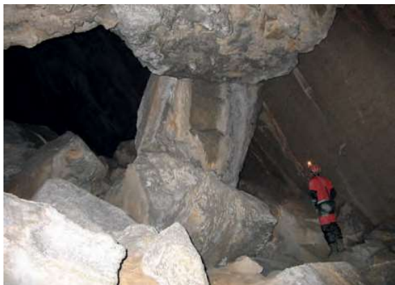
Cueva de Los Trillos.