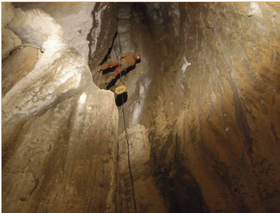
Foto tomada desde la base del P58.

tres amplios pozos con una pequeña zona horizontal de unión tras los dos primeros. El último pozo se precipita por el techo de la sala pegado a una de las paredes: Sala del Encuentro. A partir de este instante y dada la comodidad y la verticalidad de la Torca de Los Primos II (GBT-501) se utiliza ésta como acceso durante el resto de la exploraciones. P17; P58; P47.