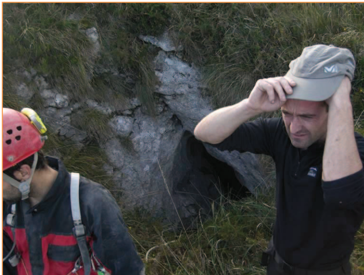
Boca de entrada. Foto realizada el mismo día que fue encontrada. Der.: imagen de la boca con el pasamanos de acceso a la cabecera del P17.